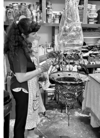
Limpieza de la lámpara de la capilla de la Inmaculada, ahora en restauración.

SI DESEAS COLABORAR CON LA BASÍLICA, CONTACTA MEDIANTE LOS CANALES HABITUALES. SI DESEAS REALIZAR UNA APORTACIÓN ECONÓMICA PARA SU MANTENIMIENTO, AL FINAL DE LA HOJA ENCONTRARÁS LOS DATOS. GRACIAS