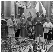
Fotografía de las ganadoras de una imagen de la Virgen del Carmen el pasado día 16 de julio, día de su fiesta, tras la Misa de las 11:00h.

El pasado 18 de julio tuvo lugar el concierto del grupo Hillingdon Music Service (Inglaterra). Gran grupo de gente joven que nos ofrecieron un concierto espléndido.