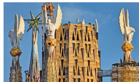
Torres dels evangelistes de la Sagrada Família

Al final de l'eucaristia, al carrer de la Marina, es beneiran les torres dels evangelistes i s'il·luminaran per primer cop els quatre terminals dels tetramorfs que simbolitzen els evangelis de Mateu (el bou), Marc (el lleó), Lluc (l'àngel) i Joan (l'àliga). L'encesa nocturna de les torres podrà veure's fins passades les festes nadalenes.