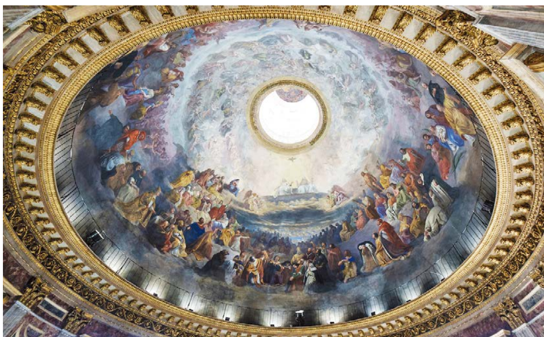
Cúpula de l'església de la Santíssima Trinitat, Turí (Itàlia)

«La litúrgia ho té tot previst», deia amb admiració l'arquitecte Antoni Gaudí. Els estudiosos de la seva vida i de la seva obra manifesten que el famós arquitecte va arribar a una gran comprensió del culte cristià. La seva formació litúrgica era tan fonda que en determinats aspectes es va avançar a algunes ensenyances del Concili Vaticà II.