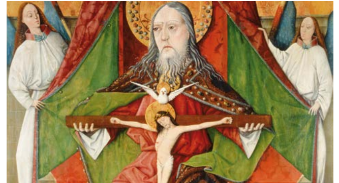
La Santíssima Trinitat (1471), Master GH. Església de la Trinitat, Mosóc (Eslovàquia)