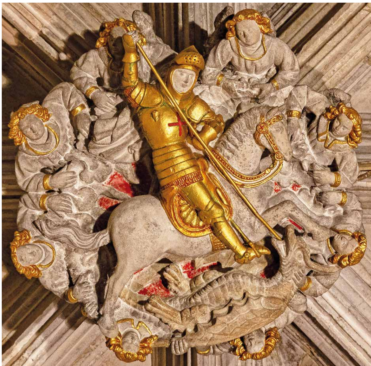
Capella de Sant Jordi del Palau de la Generalitat

Cavallerosament, aquí a la nostra terra, sant Jordi cedeix la primacia a la Mare de Déu de Montserrat, sobretot des de l'any 1881, quan el papa Lleó XIII va declarar la Mare de Déu de